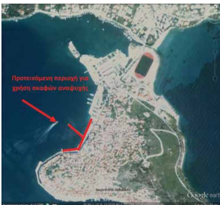
Προκήρυξη διαγωνισμού - 3.4.2013