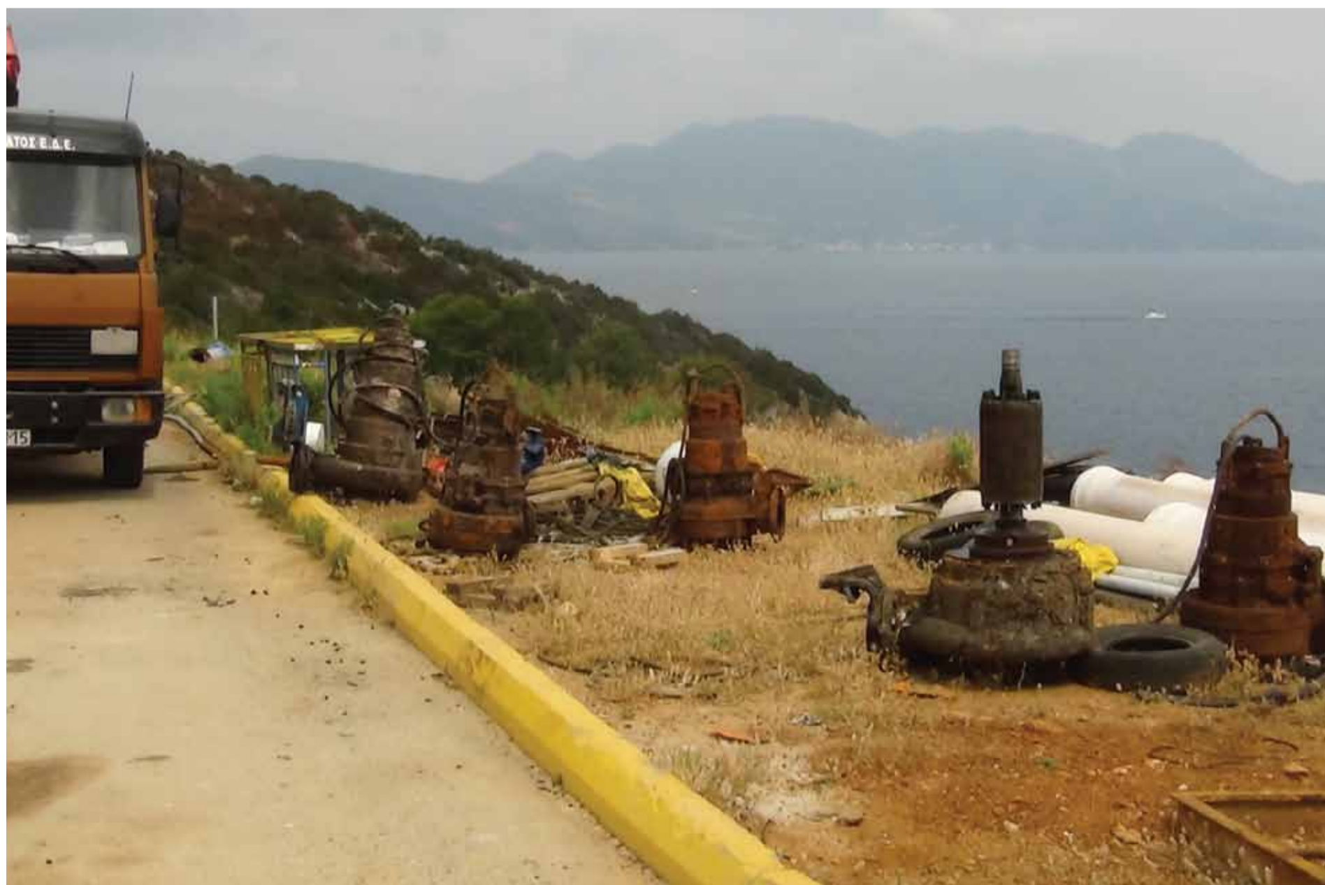
“Συλλογή” κατεστραμμένων αντλιών στη μονάδα ΒΙΟΚΑ

δ) Ότι με μακροπρόθεσμες ενέργειες μπορούν να αντιμετωπιστούν οριστικά σε βάθος 3 – 4 χρόνων όλα τα προβλήματα.