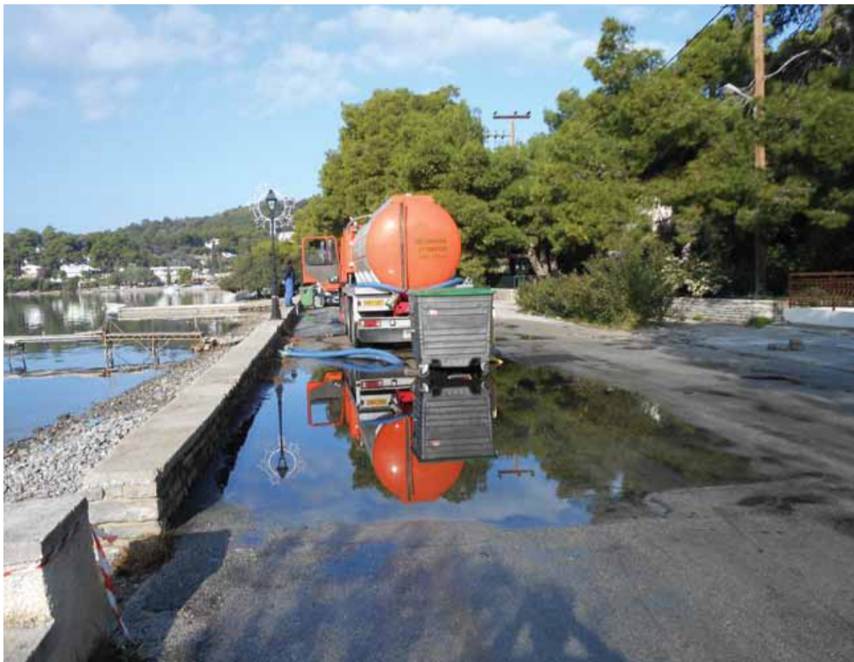
Βλάβη στο δίκτυο στις 15 Δεκεμβρίου 2013

Κανείς δεν φρόντισε για το θεσμικό πλαίσιο λειτουργίας του ΒΙΟΚΑ (δημιουργία σχετικού οργανισμού, διεύθυνσης ή τμήματος), για τη στελέχωσή του (δεν υπάρχει ούτε ένα άτομο στο Δήμο Πόρου με τη σχετική αρμοδιότητα), για την πρόσληψη εξειδικευμένου προσωπικού, για την ανάθεση αρμοδιοτήτων και τομέων ευθύνης, για την τήρηση αρχείου μετρήσεων, για τον καθορισμό υπευθύνων λειτουργίας και ασφαλείας κτλ. Επίσης, κανείς δεν φρόντισε ποτέ για τον καθορισμό του κόστους και την εξασφάλιση της χρηματοδότησης της λειτουργίας του Βιολογικού και για τη συμμετοχή του Δήμου Γαλατά και πλέον Τροιζηνίας στη χρηματοδότηση αυτή. Αντίθετα, υπήρξε δυσανάλογη και αδικαιολόγητη προτίμηση στη διάθεση πόρων για τη συντήρηση, την επιδιόρθωση βλαβών και την αγορά ανταλλακτικών. Επίσης, ο Δήμος δεν προέβη ποτέ στις απαραίτητες ενέργειες που αφορούν στην υποχρέωση των καταστημάτων υγειονομικού ενδιαφέροντος να τοποθετήσουν λιποσυλλέκτες στις αποχετεύσεις τους, στη διασφάλιση ότι τα όμβρια ύδατα δεν θα καταλήγουν στο δίκτυο, ότι δεν θα συνδέονται βόθροι με το δίκτυο, ότι θα εισπράττονται τα τέλη αποχέτευσης και ότι θα συνδέονται σωστά όλες οι οικίες και τα καταστήματα. Ποτέ, ούτε πριν το 2006, ούτε πριν το 2008, ούτε μετά, δεν θεσπίστηκε κανονισμός αποχέτευσης - λειτουργίας του ΒΙΟΚΑ και δεν συστάθηκε η προβλεπόμενη Επιτροπή του ΔΣ για τη διαχείρισή του, αρμοδιότητα της οποίας θα ήταν και πολλές από τις παραπάνω ενέργειες και έλεγχοι.